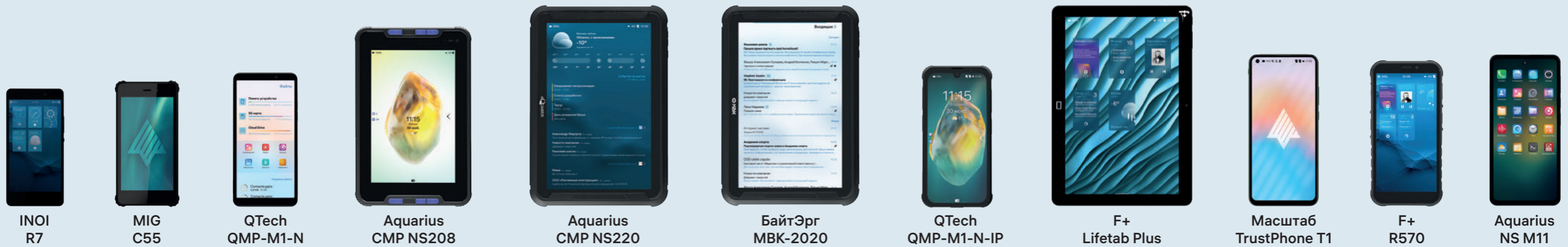
INOI R7 MIG C55 QTech QMP-M1-N Aquarius CMP NS208 Aquarius CMP NS220 БайтЭрг MBK-2020 QTech QMP-M1-N-IP F+ Lifetab Plus Масштаб TrustPhone T1 F+ R570 Aquarius NS M11