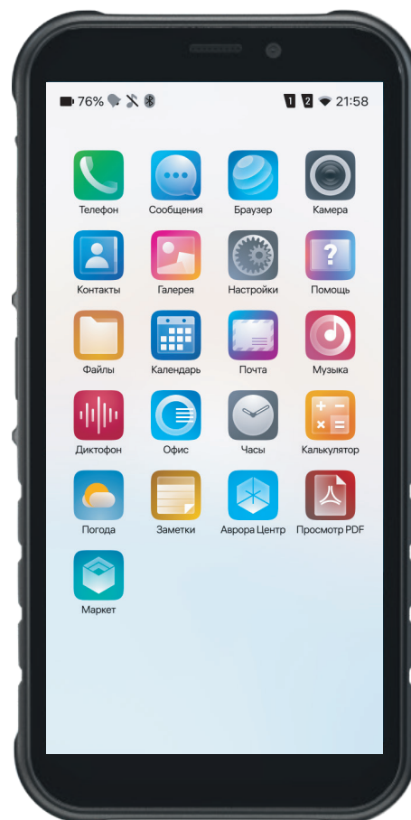
Пример управления смартфоном F+ R570 на ОС Аврора

ППО «Аврора Центр» сертифицировано ФСТЭК России по 4 уровню доверия средств обеспечения безопасности (сертификат ФСТЭК №4203 от 01.03.2021) и внесено в Единый реестр российских программ для электронных вычислительных машин и баз данных.