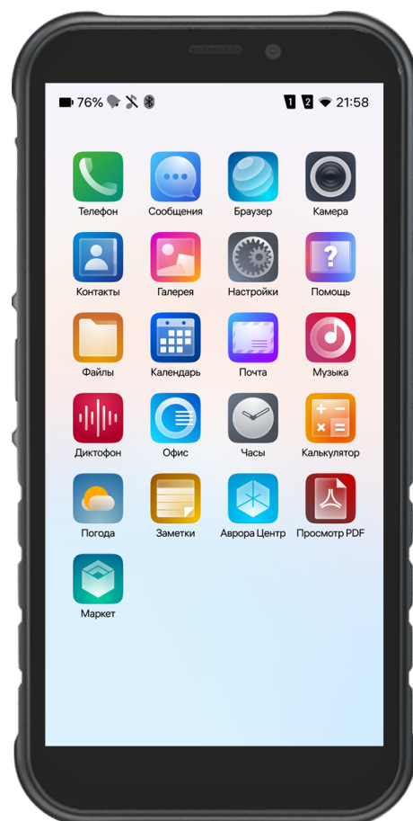
Пример управления смартфоном F+ R570 на ОС Аврора.

ППО «Аврора Центр» сертифицировано ФСТЭК России по 4 уровню доверия средств обеспечения безопасности (сертификат ФСТЭК №4203 от 01.03.2021) и внесено в Единый реестр российских программ для электронных вычислительных машин и баз данных.